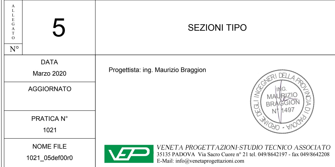
SEZIONE TIPO 1 scala 1:50 OPERE NELLA FRAZIONE VILLALTA